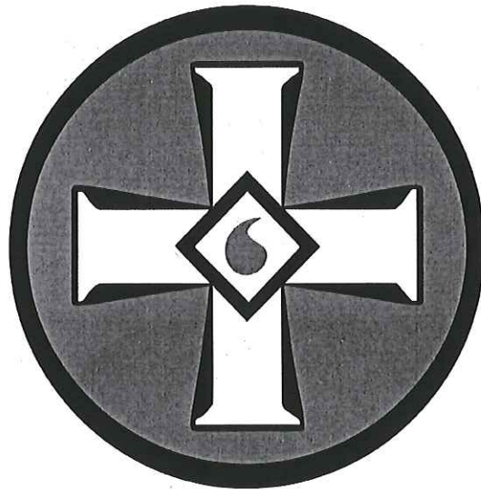
Рисунок 1. Эмблема ультраправой организации «Ку-клукс-клан»