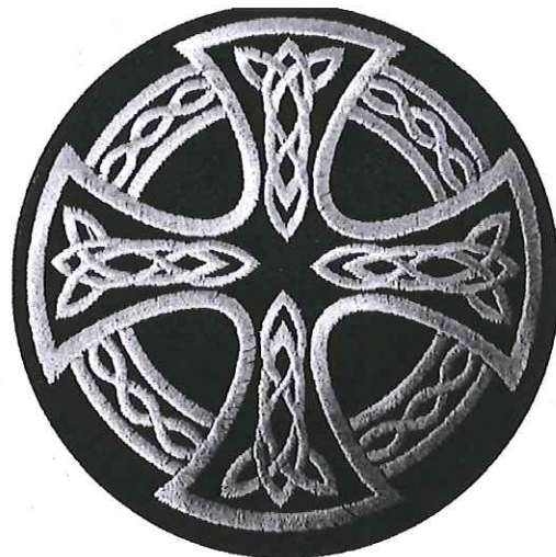
Рисунок 2. Кельтский крест. Символ многих расистских организаций